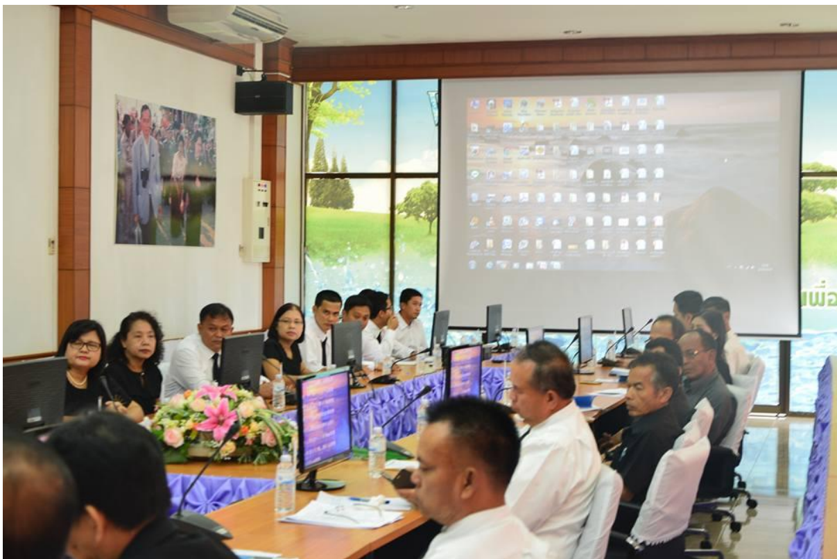
ฝ่ายจัดสรรน้ำ โครงการชลประทานพัตลุง