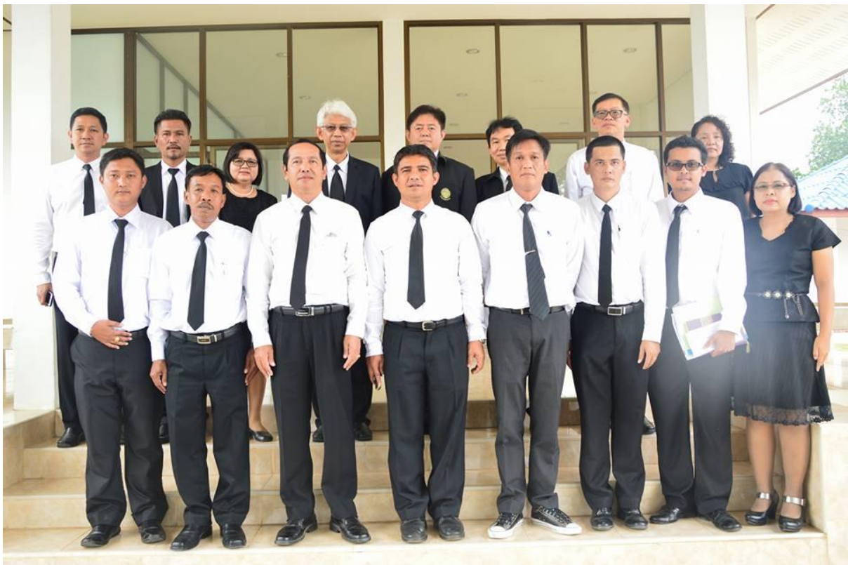
ฝ่ายจัดสรรน้ำ โครงการชลประทานพัทลุง